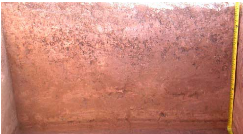
Fig. 5. Perfil norte de pozo de prueba 6, Sitio JM-48