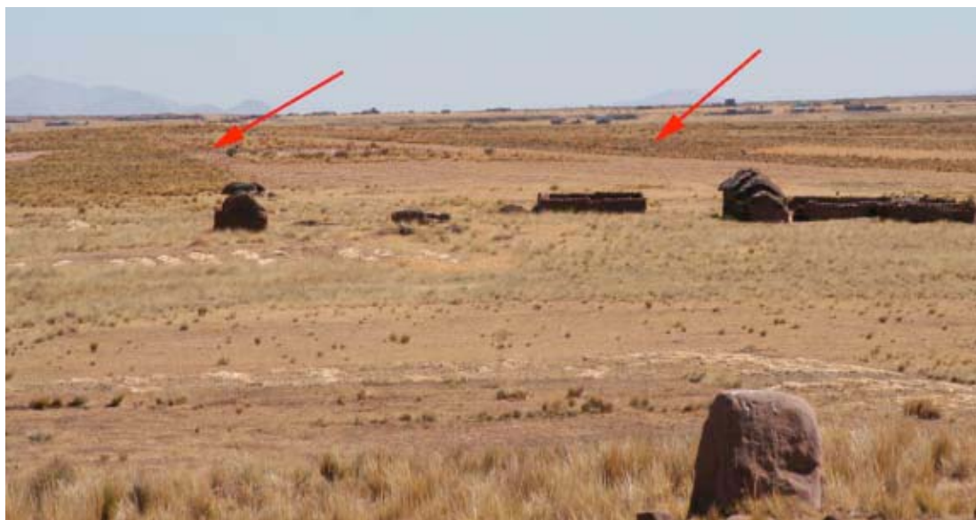
Fig 1. Vista a los montículos “Kimsa Kontu” desde Khonkho Wankane

Dos grandes montículos, Khonkho y Putuni, dominaron el área local durante el Formativo Tardío y dominaron el registro arqueológico de estos sitios, pero muchos otros montículos pequeños existieron en el área, por lo que esperamos que existieran otras pequeñas ocupaciones en los sitios cercanos. Tanto Khonkho como Putuni son parcialmente artificiales, y es posible que otros montículos en el área también lo sean y estuvieran ocupados al mismo tiempo que los montículos más grandes. La prospección identificó tres posibles montículos (Sitios 46, 47, y 48) cuyos artefactos de superficie incluyeron cerámica representando un rango de estilos, notablemente del Formativo Tardío 1 y 2 (Lémuz Aguirre 2006: 33-34). Estos tres sitios presentaron las dispersiones cerámicas en superficie del Formativo Tardío más grandes y densas del área (Fig. 1). Esperando descubrir los correspondientes componentes enterrados, realizamos excavaciones en estos tres montículos para examinar las relaciones que estos sitios más pequeños tenían con el más grande y central. Siguiendo el modelo de muchos otros estados en el mundo, esperamos que un gran núcleo podría estar rodeado por sitios más pequeños ubicados cerca de los campos agrícolas que sostienen las poblaciones más densas y grandes del núcleo.