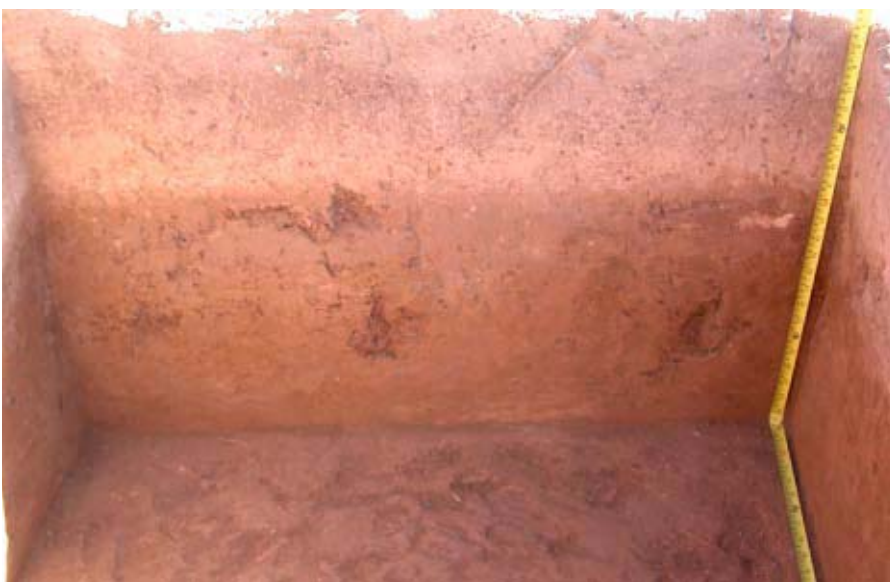
Fig. 3. Perfil norte del pozo de prueba 5, Sitio JM-46