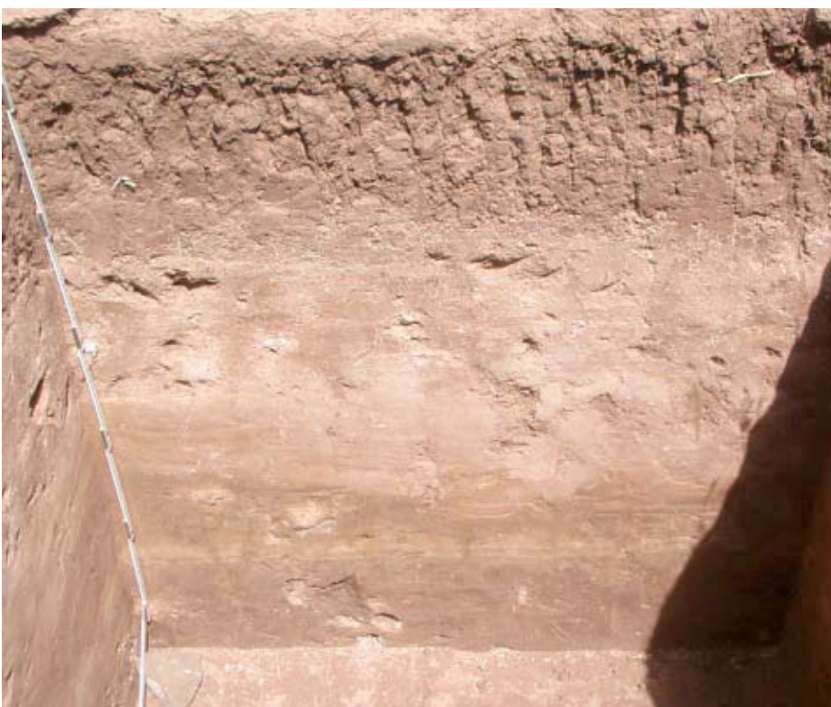
Fig. 4. Perfil sur del pozo de prueba 3, Sitio JM-47